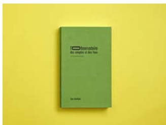
Lise Duclaux N°12 L'Observatoire des simples et des fous, ce n'est pas si simple 2017, Lise Duclaux à lire à la loupe et les auteurs Expert : Carine Bienfait (BE)