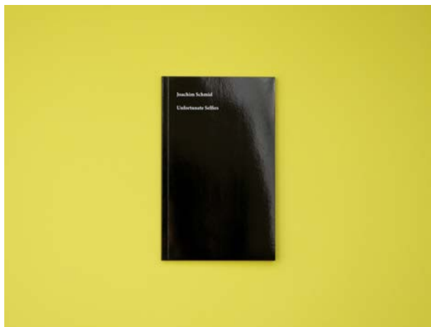
Joachim Schmid Unfortunate Selfies 2016, self-published Experts : Lilian Landes, Rüdiger Hoyer (DE)