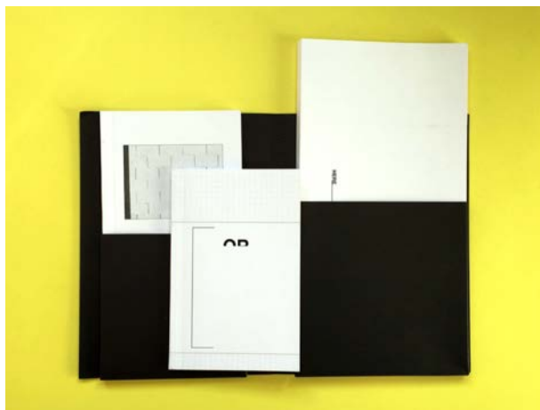
Peter Downsbrough HENCE / HERE ... / OR 2018, Avarie edition Expert : Giovanni Iovane (IT)