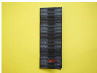
Richard Roberts N°05 Tower Block 2017, self-published Expert : Arnaud Desjardin (GB)