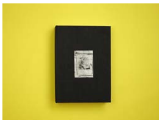
Hubert Humka N°36 Death Landscapes 2018, Blow up Press Expert : Katarzyna Krysiak (PL)