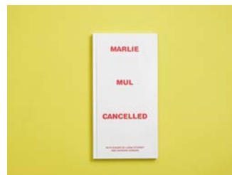
Marlie Mul N°06 Cancelled 2018, self-published Expert : Arnaud Desjardin (GB)