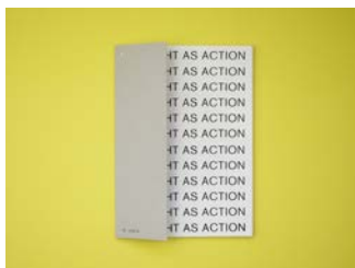
Ariadna Serrahima N°23 It's all about gestures 2018, self-published Expert : Moritz Küng (ES)