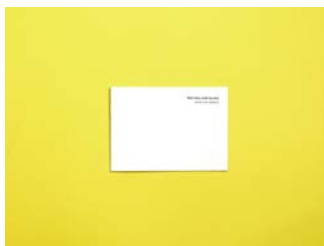
Egon Van Herreweghe N°13 Still life with books (and one object) 2018, éditions Ménard Expert : Carine Bienfait (BE)