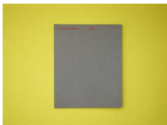
Algirdas Šeškus N°19 Gélés 2018, Biel Books Expert : Mela Dávila-Freire (ES)