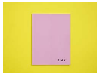
Emil Michael Klein N°37 EMK 2017, Kunsthalle Zurich Expert : Christoph Schifferli (CH)